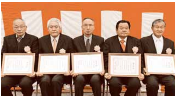
写真右から10年間無火災表彰の、あま市七宝町鷹居地区様、あま市丹波地区様、5年間無火災表彰の、あま市七宝町下之森地区様、あま市中萱津地区様、街頭防火活動等協力表彰の、株式会社ビーアンドディードラッグストア七宝店様 ※株式会社アオキスーパー大治南店様は都合により欠席

平成29年12月7日あま市上萱津地内において発生した建物火災で、迅速な二九番通報及び初期消火を行ったことにより、被害を最小限にとどめた3名の方に対し、海部東部消防組合消防長から感謝状を贈呈しました。