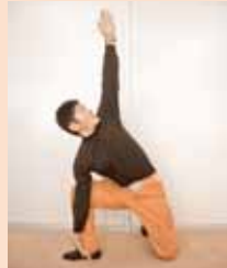
オープンゲートポーズ

床に膝立ちし右足を立てて真横に開き、膝は直角。右手で右足首をつかみ左手は真上に伸ばす。体側の伸びを感じましょう。