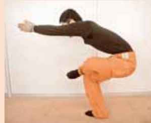
フラミンゴバランスポーズ

右足を軸に片足立ちし、左の足首を右膝の上にかけて左膝を開く。お尻を突き出すように股関節を曲げ、同時に右膝を曲げる。