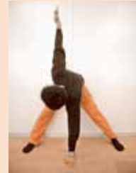
ピラミッドツイストポーズ

開脚し顔の真下に左手を置き右手を天井方向に伸ばす。左手で床を押し、肩甲骨を真っすぐにする。