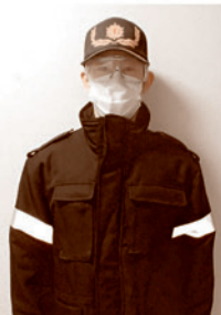
正しい予防をした全体図