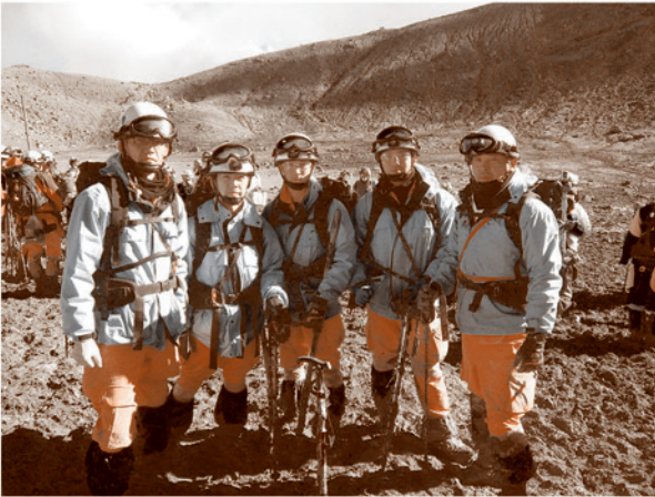
緊急消防援助隊愛知県隊に派遣された職員

そのような状況下で、当消防組合も救助隊員5名を編成し、平成26年10月7日の午前11時18分に当消防本部を出発、翌朝の午前3時00分から救助活動の準備を始め、約5時間にも及ぶ検索活動を実施しました。更に、活動終了後も次隊との引き継ぎを行い、息つく間も無く帰路へ向かい、翌9日の午前0時30分、当消防本部へ帰署しました。ここでは、その3日間にも及ぶ過酷な活動を行った隊員に手記を執筆してもらいましたので、掲載させていただきます。