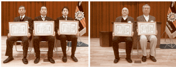
写真右から順に、5年間無火災功勞の、あま市富塚地区様、あま市栄地区様、消防協力表彰のヒバリヤ美和店様、アオキスーパー大治店様、ベルズ七宝

5年間無火災の功勞 あま市 富塚地区 様 あま市 栄地区 様 消防協力表彰 ヒバリヤ美和店 様 アオキスーパー大治店 様 ベルズ七宝 様