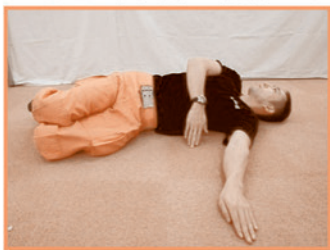
両ひざを横に倒す。