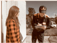
住宅訪問調査の様子