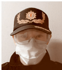
正しい予防をした状態