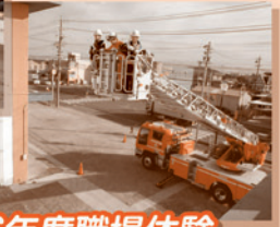
平成26年度職場体験