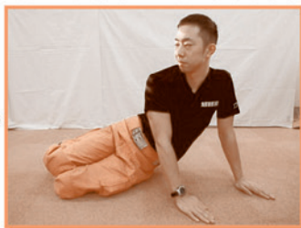
手で体を支えながら上体を起こす。