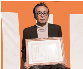
あま市木折地区 様