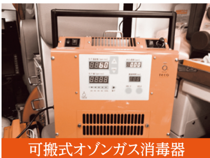
可搬式オゾンガス消毒器