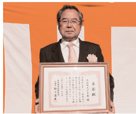
大治町大字馬島 様