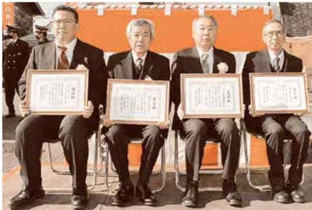
写真右から あま市七宝町下之森地区 様 あま市中萱津地区 様 大治町八ツ屋地区 様 株式会社コノミヤ コノミヤ甚目寺店 様

令和5年1月12日(木)に挙行いたしました消防出初式において、令和4年中、消防行政に尽力された方々を表彰しました。 【無火災表彰】(敬称略、順不同) 10年間無火災 あま市七宝町下之森地区 あま市中萱津地区 5年間無火災 大治町八ツ屋地区 【感謝状】(敬称略、順不同) 株式会社コノミヤ コノミヤ甚目寺店 株式会社スギヤマ 大治店 (街頭防火広報協力)