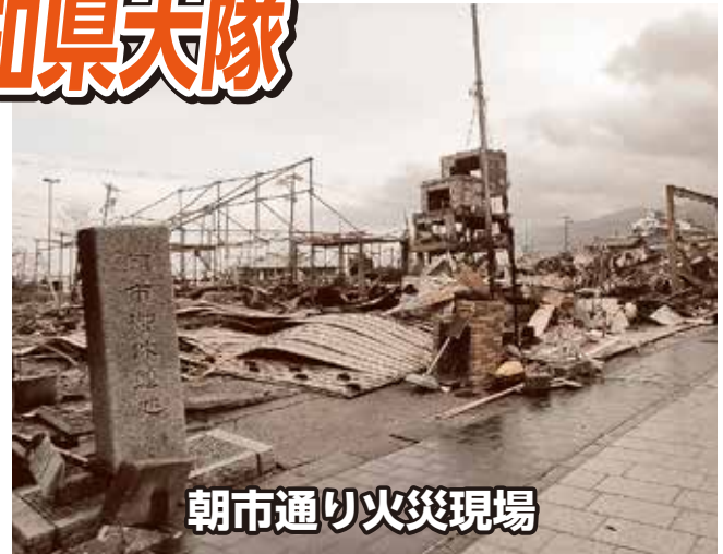
朝市通り火災現場

令和6年1月1日16時10分、石川県能登半島沖を震源とするマグニチュード7.6、最大震度7の地震が発生しました。海部東部消防組合は、緊急消防援助隊愛知県大隊として1月1日から1月25日まで計40名の隊員が被災地へ出動し、主に救助及び救急活動を実施しました。