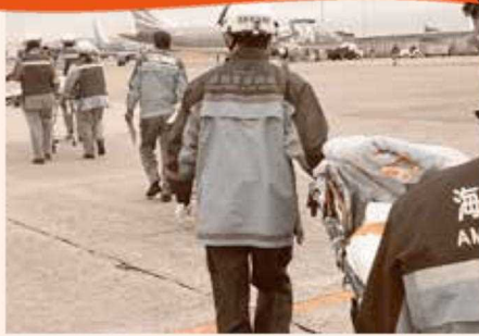
能登半島地震発生により石川県から愛知県内の病院へ広域搬送した様子です。 場所:県営名古屋空港

消防署の「担当」について紹介していきます。今回は、救急救命士!専門学校で資格を所得して消防士になる人もいますよ。