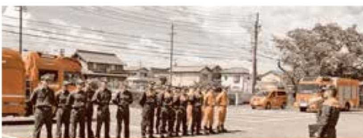
名古屋市消防局及び西春日井広域事務組合消防本部と合同連携訓練を実施しました。