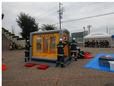
除染 TENT 設置