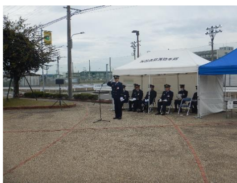
開会式 消防長挨拶

大治化学工場内のアンモニア水貯蔵タンク（劇物）の配管が破損したことによりアンモニア水が漏洩。多数の要救助者が発生し、事案の収束を図るために応援要請を行う。