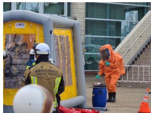
回収された漏洩物