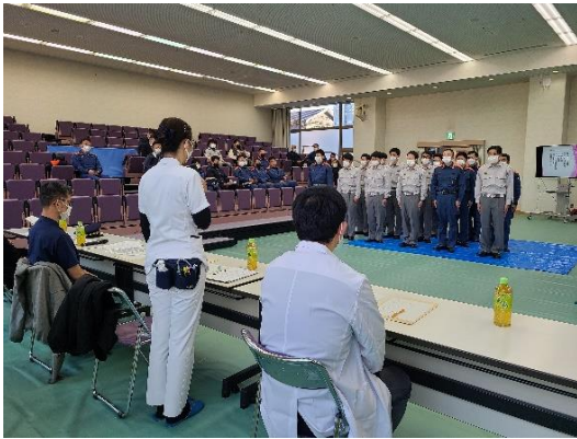
医師・看護師総評