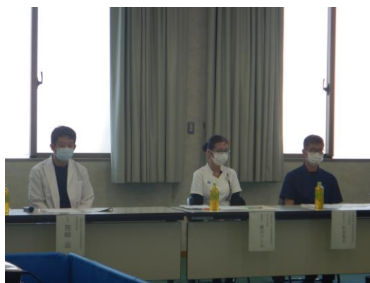
医師・看護師紹介