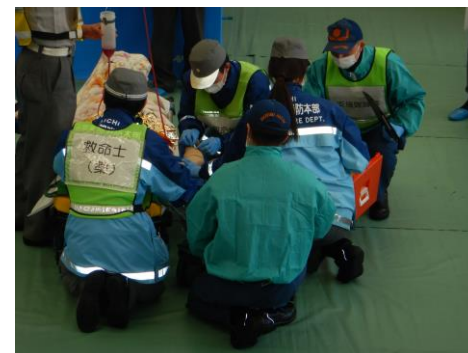
【想定】75歳男性、自宅居室で倒れているのを訪れた家族が発見し救急要請。低体温想定。