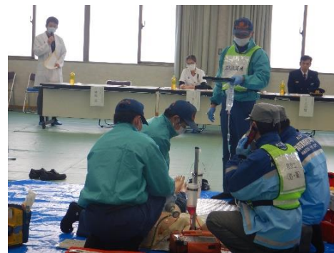
【想定】70歳男性、就寝中に胸の痛みを訴えたため妻からの救急要請。心肺停止想定。