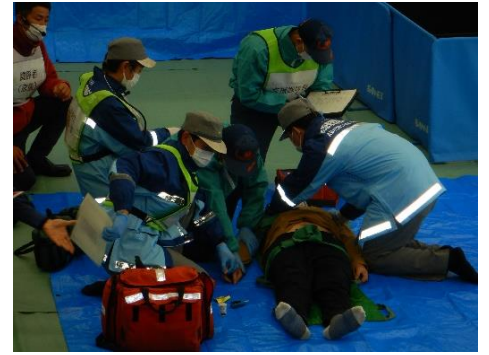
【想定】63歳男性、自宅で友人と食事中に突然倒れたため救急要請。低血糖想定。