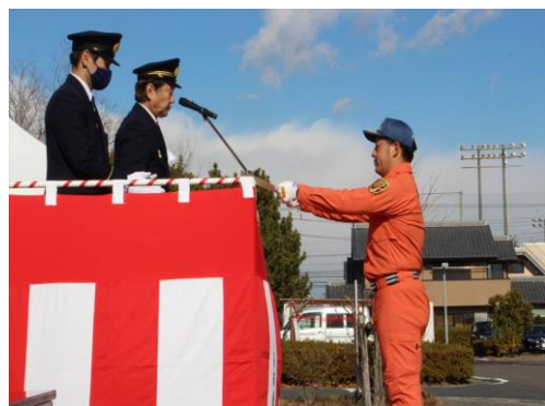
緊急消防援助隊 能登半島地震出動隊員