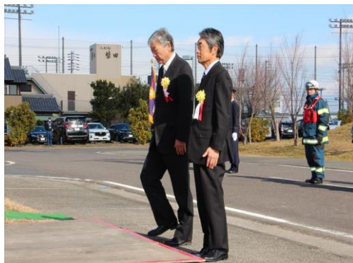
5年無火災 金岩地区様 東溝口地区様