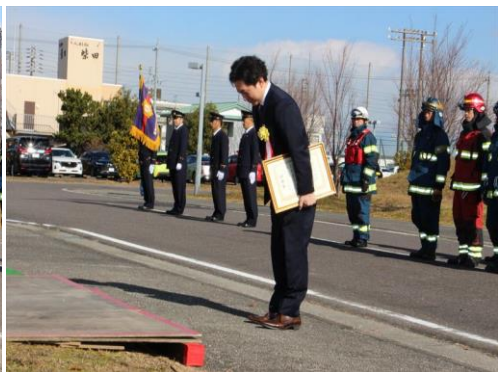
株式会社サンドラッグ美和店様