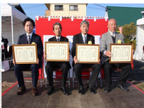
今後も、当組合の防火防災に ご協力をお願いします。