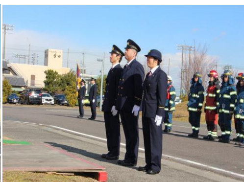
長期勤続功労表彰