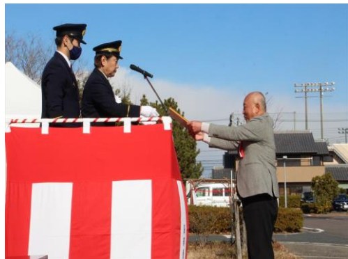
15年無火災 富塚地区様