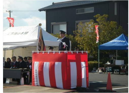
海部東部消防組合