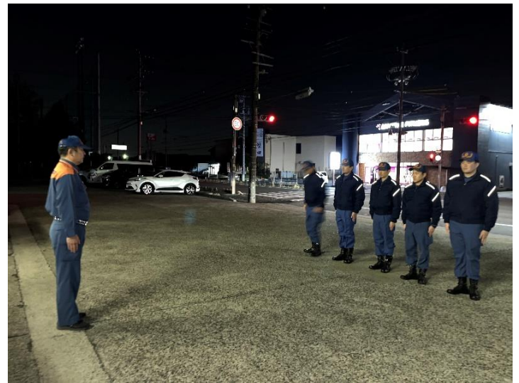
1月10日4時 第四次隊派遣職員5名 出発