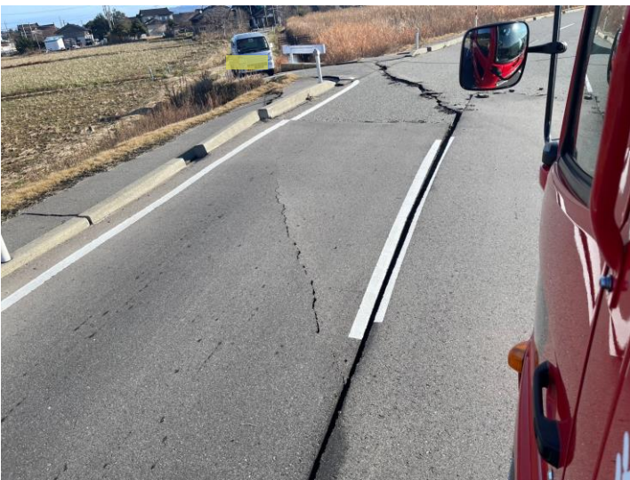
緊急消防援助隊 愛知県大隊活動地状況