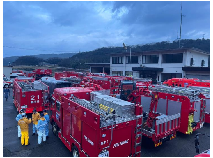
緊急消防援助隊 愛知県大隊